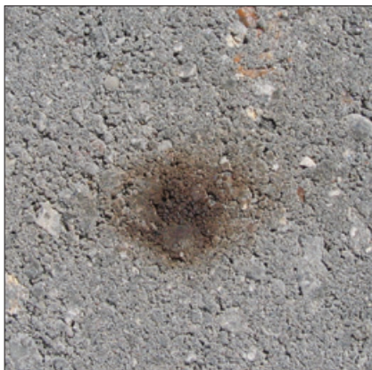
Forskellige former for jernudfældninger. Nogle typer forsvinder med tiden, andre gør ikke.