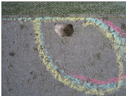
Et hul i overfladen som følge af porøst korn i tilslaget, opstår normalt inden for det første år.

Der kan nogle gange observeres små huller eller fordybninger i overfladen. De vil typisk opstå inden for det første år. Fordybningerne opstår, hvis der i tilslaget af sten og grus også har været noget porøst materiale, f.eks. en lille hård lerklump. Denne kan ikke ses efter støbningen, men ligger den i overfladen vil den efter nogen tid gå i opløsning og efterlade en fordybning. Derfor er det ikke muligt for producenten at sortere emnet fra før levering. Det må ikke være generelt forekommende.