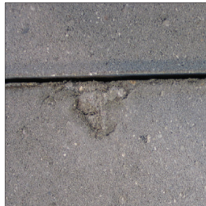
Øverst ses revner i overfladen som følge af fejl i støbningen eller håndteringen. Nedenunder et eksempel på mangelfuld fyldning af formen, der har givet en fordybning i kanten af flisen, skal sorteres fra før lægningen.