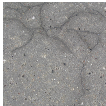
Eksempel på alkalikiselreaktioner, også kaldet "spindelvæv".

I alt beton, er der risiko for alkalikiselreaktioner, men i betonsten og -fliser er risikoen meget lille pga. flere forhold. Reaktionen består i, at porøs flint reagerer med cementen og danner en gel. Denne gel kan suge vand og eks-