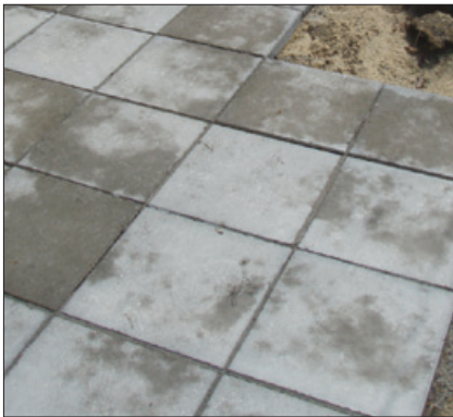
Varierende porestruktur kan give et udseende som dette, når fliserne tørrer ud efter regnvejr. Det er ikke tegn på manglende modstandsevne over for påvirkninger fra frost/tø og salt.

har været våde, vil man kunne se, at der er forskel på, hvor hurtigt de tørrer igen. Nogle tørrer på få timer, andre bruger et døgn eller mere. Der er tale om uundgåelige variationer, som kun har betydning for flisens udseende. En flise med en åben struktur, har ikke større risiko for skader som følge af frost/tø-påvirkninger og salt end en med mere lukket struktur. Betonens struktur vil med tiden blive mere lukket, da partikler fra omgivelserne og kalkudfældninger er med til at gøre dem tættere.