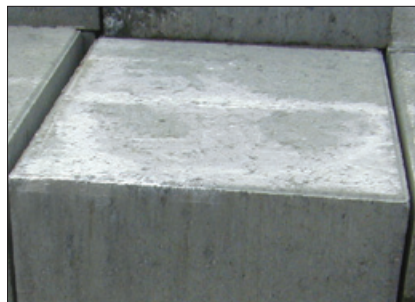
Disse kalkudfældninger er almindelige og forsvinder i løbet af 1-2 år.

Kalkudfældninger kan opstå på nye betonbelægninger, og er en naturlig del af hærdeprocessen. Udfældningerne forsvinder normalt i løbet af 1-2 år, i særlige tilfælde op til 3 år. Kan man ikke vente på at de forsvinder, eller er