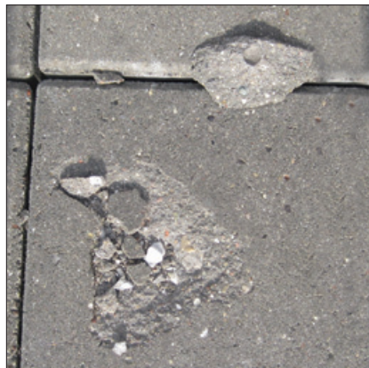
En "kalkspringer", dvs. en vandmættet kalksten har udvidet sig i frostvejr, og presset en flage af betonen.

nerelt. Som tommelfingerregel bør der maksimalt være 10 huller større end 1,5 cm 2 pr. 10 m 2 belægning.