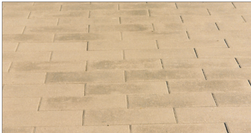
Lader man fugegrus henligge på belægningen, risikerer man afsmitninger, der i værste fald bliver bundet af kalkudfældninger.

pandere, hvorved der opstår fine revner i betonen. Stikprøver har vist, at de fine revner ikke giver større risiko for afskalninger som følge af frost/tø-påvirkninger. I sjældne tilfælde, hvor det er større revner, kan det have en nedbrydende effekt. På betonbelægninger opstår dette fænomen praktisk talt kun ved overdreven brug af tørsalte. Se nærmere om korrekt brug af tørsalt i publikationen "Vedligeholdelse af betonbelægninger".